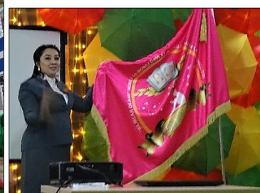
L'école et l'équipe éducative