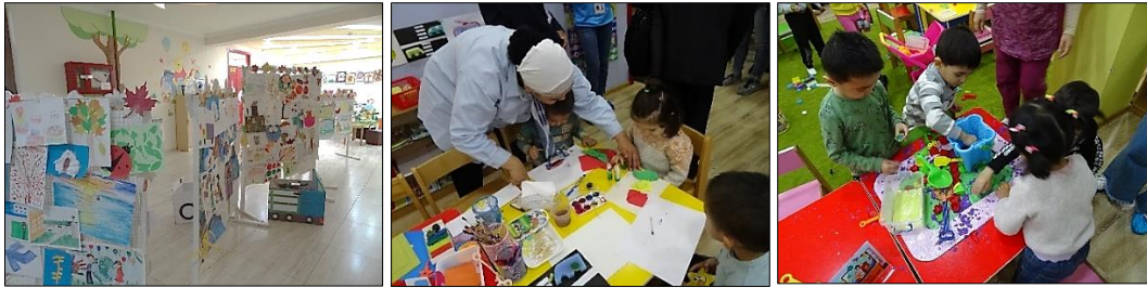
Les activités artistiques