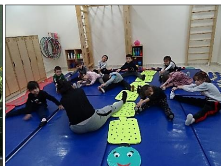
Les activités jardinage et éducation physique