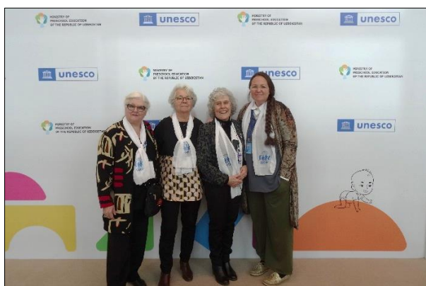
Les représentantes OMEP à l'ONU/UNESCO

https://www.unesco.org/fr/education/early-childhood/2022-world-conference