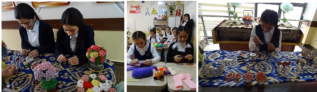
Les travaux manuels pour les filles