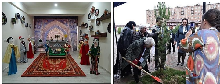
Le respect des traditions : planter l'arbre de l'amitié