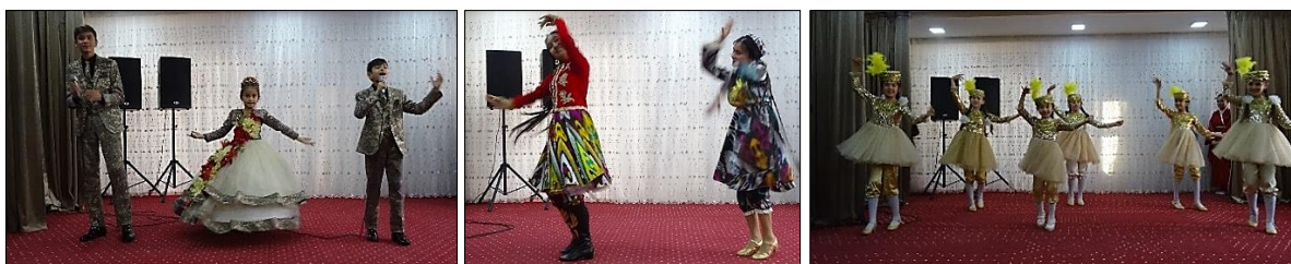
Spectacle de danses traditionnelles et de poésies