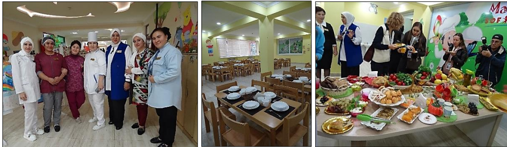
L'accueil au restaurant scolaire