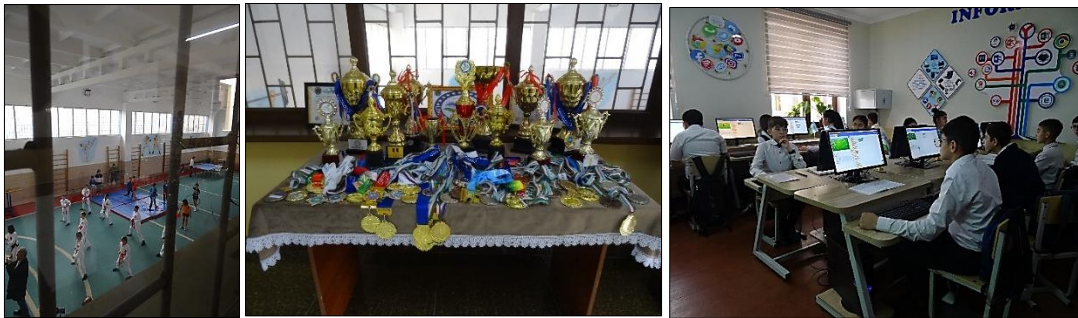
Le sport en salle ; la salle informatique