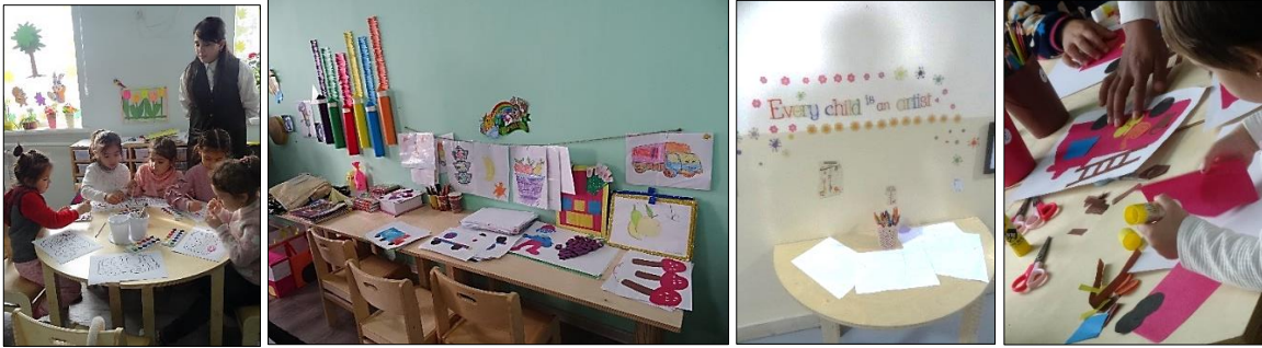
Graphisme, découpage, collage